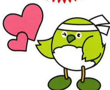
大分県応援団“鳥”めじろん