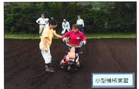
就農準備研修での研修風景